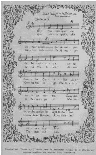
Imagen 4. Del programa de mano del 29 de septiembre de 1954.