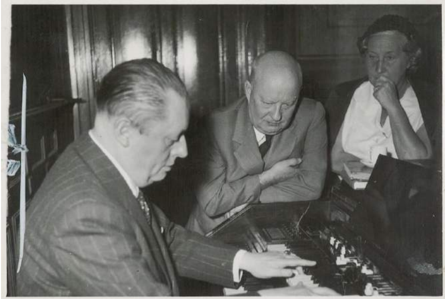
Imagen 7. Paul Hindemith y su esposa Gertrud Rottenberg observan atentamente a Julio Perceval en el órgano. Fondo Documental Julio Perceval (UNCuyo) 1