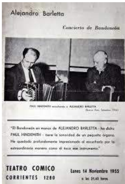
Imagen 8. Afiche de un concierto de Alejandro Barletta, en 1955. En la foto tomada en septiembre de 1954, Paul Hindemith lo escucha con atención.