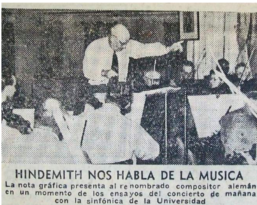
Imagen 5. Diario Los Andes , 6-X-1954. p. 5.

Antes del concierto, en un acto especial del que participaron autoridades provinciales y universitarias, le otorgaron el título de ‘Miembro Honorario’ del Instituto de Estudios Musicales de la Facultad de Filosofía y Letras de la Universidad Nacional de Cuyo. 31