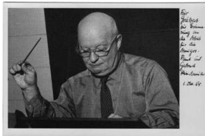
Imagen 1. Postal enviada por Hindemith a Graetzer, luego de la gira.

campo de la educación musical argentina. Para ello había convocado –entre otros- a Ernesto Epstein y a Erwin Leuchter. 10