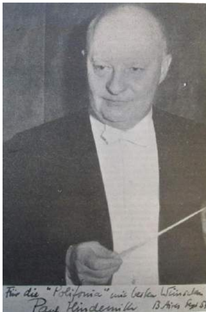
Imagen 9. Revista Polifonia , Año IX, N° 84-85, Ago-Sept, 1954. Dedicatoria: Für die "Polifonia", mit besten Wünschen [Para "Polifonia" con los mejores deseos]

Con su visita "Buenos Aires vuelve a una tradición añeja: ponerse personalmente en contacto con las figuras salientes de la creación musical." 41