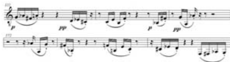
Ejemplo 5: Humpty Dumpty , Marta Lambertini. Cc. 122-124 y Cc. 174-172

Otro ejemplo puede encontrarse en la comparación de los dos fragmentos del Ejemplo 5: