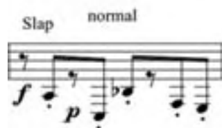
Ejemplo 7: Humpty Dumpty , Marta Lambertini C. 2