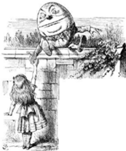
Ilustración original incluida en A través del espejo... por John Tenniel

visto como un huevo antropomórfico, vestido con traje y de un gran tamaño, bastante torpe y algo soberbio.