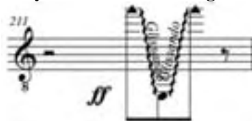
Ejemplo 14: Humpty Dumpty , Marta Lambertini C. 211