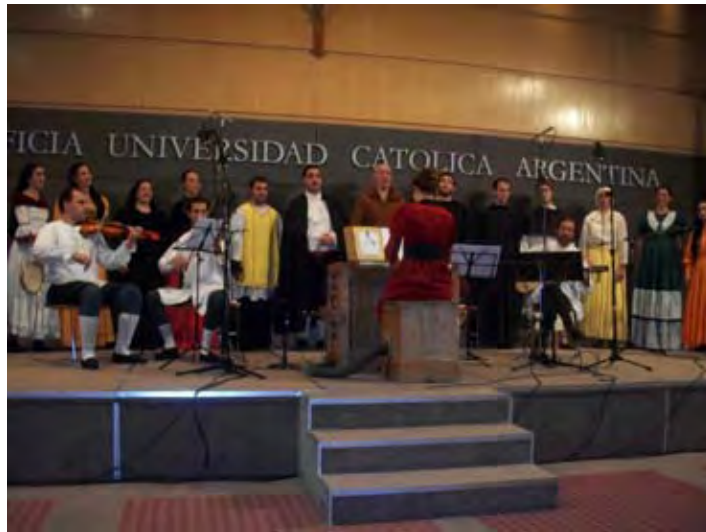
Coro Carmina Gaudii (UCA, Paraná)

II- Comedia de San Eustachio de Esteban Ponce de León (1750). Coro Carmina Gaudii (UCA, Paraná) Directora: Lic. Evangelina Burchardt.