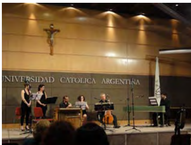
Conjunto “Ensamble de Música barroca” del IUNA