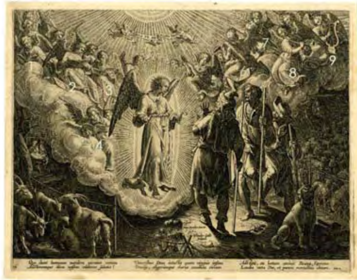
Imagen 4- Theodore Galle, “La aparición del ángel a los pastores”, grabado sobre papel, en Jan van der Straet, Encomium Musices , Amberes: Philippe Galle, ca. 1589-1590, lámina 16

personajes alados que surcan el incomparablemente límpido azul celeste de sus cielos.