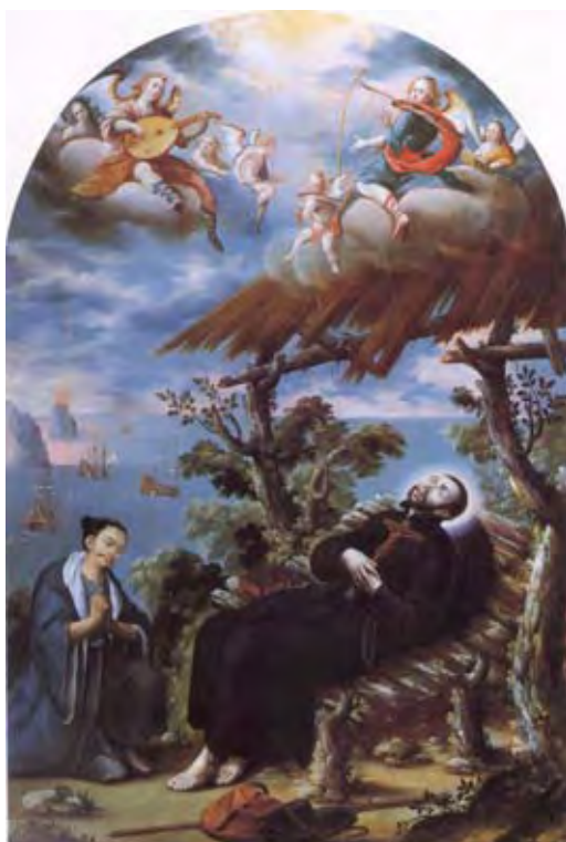
Imagen 6.a- Conrado, s. XVII, La muerte de san Francisco Javier , óleo sobre tela, Pinacoteca del Oratorio de San Felipe Neri (La Profesa), Ciudad de México

cerró sin permitirnos acceder a esta información. Por tal razón desconocemos si el modelo rubensiano y las adiciones a éste le fueron sugeridas a Conrado por alguno de los doctos miembros de la Compañía o fueron fruto del gusto y la erudición del propio pintor.