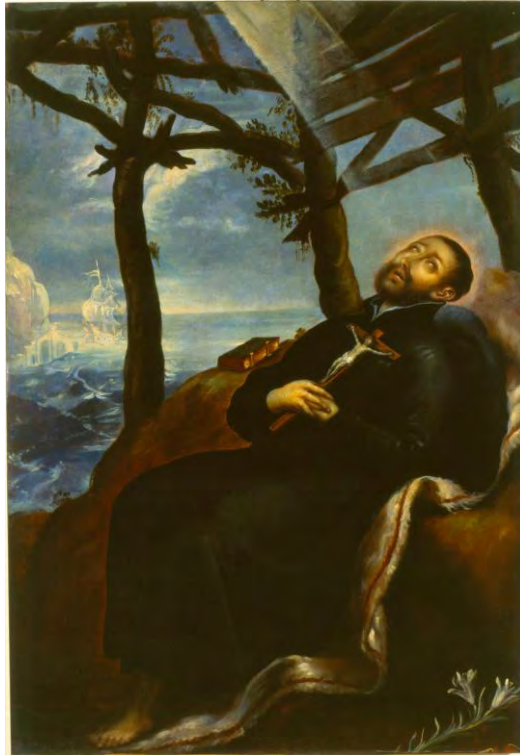
Imagen 6.b- Anónimo, s. XVII, La muerte de san Francisco Javier , óleo sobre tela, Museo Nacional de Arte, Ciudad de México.