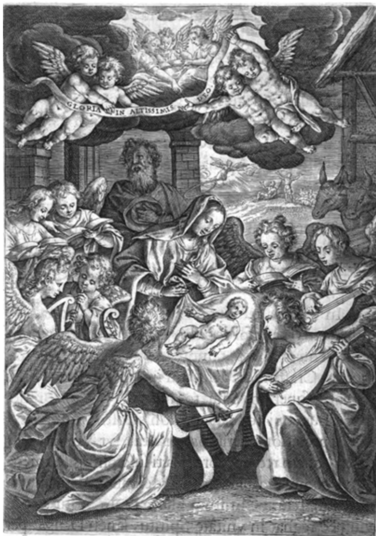
Imagen 2.a- Pío V, Officium Beatae Mariae virginis... , Amberes: Plantino-Moreto, 1609, p. 568