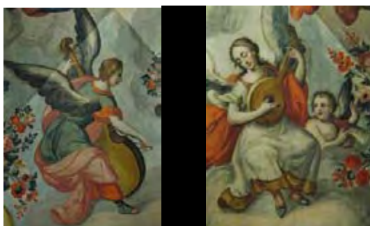
Imágenes 3.a y 3.b- Anónimo, siglo XVIII, La apoteosis de San José (detalle), pintura mural al temple, templo de San Francisco Javier, Museo Nacional del Arte Virreinal, Tepotzotlán, Estado de México

las manos del primero 31 y la parte inferior del cuerpo, probablemente aportación propia del autor del mural—, están resueltas de manera mucho más satisfactoria que la morfología del cordófono depositado en sus manos que en la versión novohispana se proveyó de la caja acústica redonda con fondo plano (imagen 3.b).