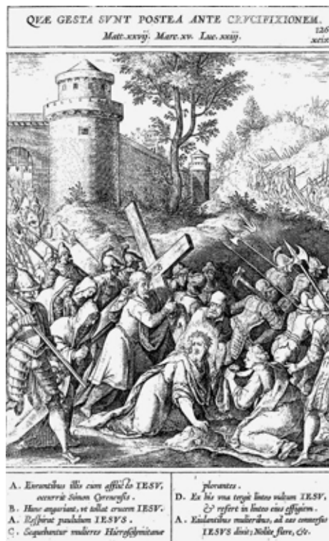
Imagen 8.a- Hieronymus Natali, Evangelicae historiae imagines... , Amberes: Plantino-Moreto, 1596, p. 126.

“Aquel Rostro ensangrentado/ limpia con piedad no poca/ una Muger, y en su toca/ queda amante retocado:/ En triplicado traslado/ le paga el divino amor/ con el pincel del dolor/ le pinta Imagenes tres;/ y por piadosa esta vez/ toca en su Toca el favor”.