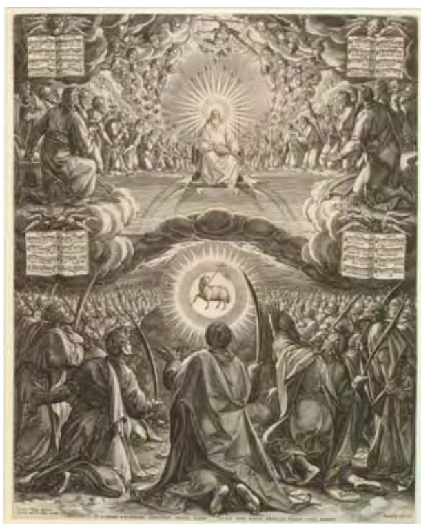
Imagen 1.a- Johann Sadeler I, El Apocalipsis , 25 grabado, Venecia, 1588

voces del motete de André Pevernage (1543-1591) que lo integra—, y no obstante contribuir, como toda versión literal, a llenar lagunas en el conocimiento de la iconografía musical europea en circulación en el virreinato, habiendo sido realizado dos siglos más tarde que el original, el óleo de Toluca establece una distancia igual de amplia entre la imagen que evoca y el repertorio en boga en la Nueva España del siglo XVIII (imágenes 1.a y 1.b).