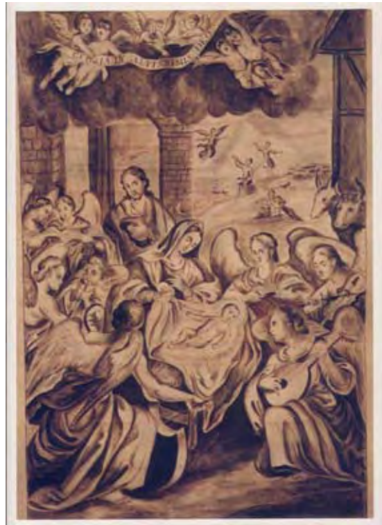
Imagen 2.b- Joseph Andrés Gastón y Balbuena, 1762, El nacimiento de Cristo , 29 grisalla sobre pergamino, Liber communis canticorum... , f. 92, Museo Nacional del Virreinato, Tepotzotlán, Estado de México

En cambio, las características anatómicas del intérprete del laúd cuya imagen también integra elementos de diferentes figuras de la misma escena de la Natividad —la cabeza del segundo laudista del grabado flamenco, 30