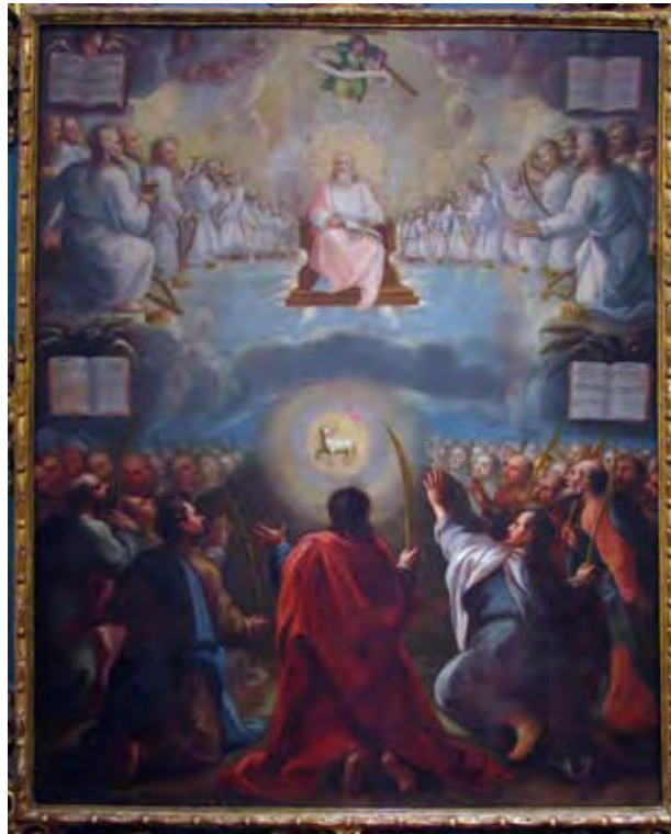
Imagen 1.b- Anónimo, s. XVIII, El Apocalipsis , óleo sobre tela, Museo de Bellas Artes, Toluca, Estado de México

Las versiones modificadas o aquellas que recreando una determinada fuente gráfica alteran su contenido musical, aun cuando no llegan a ocupar un lugar preferente entre las diferentes fórmulas de préstamos que hemos especificado, se caracterizan por una representatividad mucho más considerable en el arte virreinal que la que tienen las versiones literales y permiten distinguir entre dos procedimientos básicos, a partir de los que se concebían, a saber: