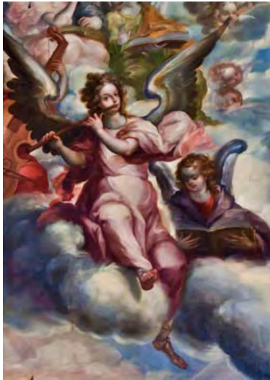
Imagen 5- Cristóbal de Villalpando, Triunfo del arcángel San Miguel (detalle), óleo sobre tela, Catedral Metropolitana de México, Ciudad de México

La creación de las imágenes integradas a partir de la transposición y mutación de los elementos de una sola fuente en el arte sacro del virreinato a menudo viene acompañado por un procedimiento aún más complejo que es la compilación de varias fuentes, europeas o novohispanas. Éstas son las versiones combinadas que, amén de poner en evidencia el préstamo, ofrecen muestras de la originalidad e independencia de visión creativa de los pintores que hicieron uso de este recurso. 37 Sobraría explicar que la identificación de los préstamos que, fundidos en el crisol de una personalidad artística, se amalgamaron en una versión combinada,