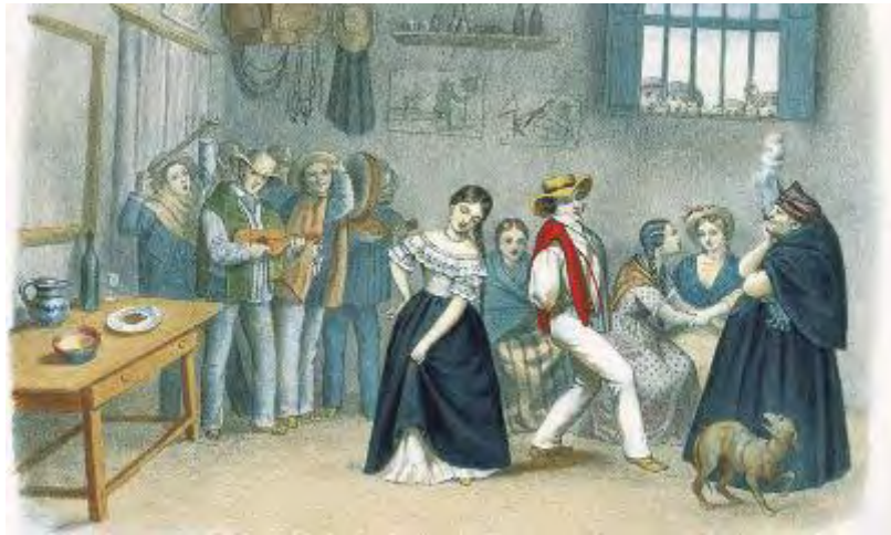
Imagen 5- Torres Méndez: Baile de campesinos 35