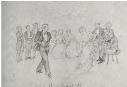
Imagen 3- El bambuco de Ramón Torres Méndez 33