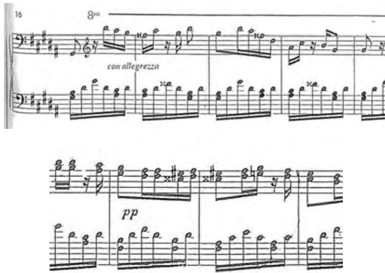
Imagen 7- Párraga: El bambuco. Aires nacionales neogranadinos variados para piano op. 14

El periódico El Tiempo del 1 de marzo de 1859 37 anunció la llegada a Bogotá para la venta, de algunos ejemplares de composiciones de Manuel María Párraga (c.1820-c.1890), pianista venezolano, en su momento neogranadino, que se radicó por algún tiempo en la capital. La edición, realizada por Breitkopf & Härtel de Leipzig titulaba una de las piezas: El bambuco. Aires nacionales neogranadinos variados para piano op. 14 38 .