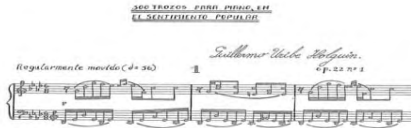
Imagen 8- Uribe Holguín: Trozo en el sentimiento popular, op. 22 No. 1

Y esa métrica para el bambuco parece haberse mantenido en el tiempo. La encontramos en algunos de los Trescientos trozos en el sentimiento popular escritos entre 1927 y 1939 por el compositor Guillermo Uribe Holguín (1880-1971), como una serie de obras para piano en las que privilegia aires andinos de bambuco y torbellino 39 .