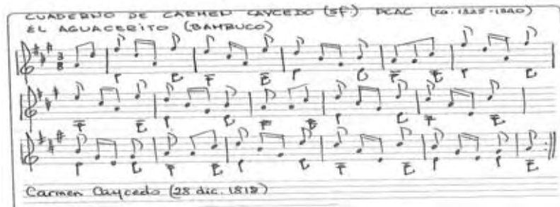
Imagen 4- Anónimo: El aguacerito, bambuco. (Cuaderno de guitarra de Carmen Caycedo)