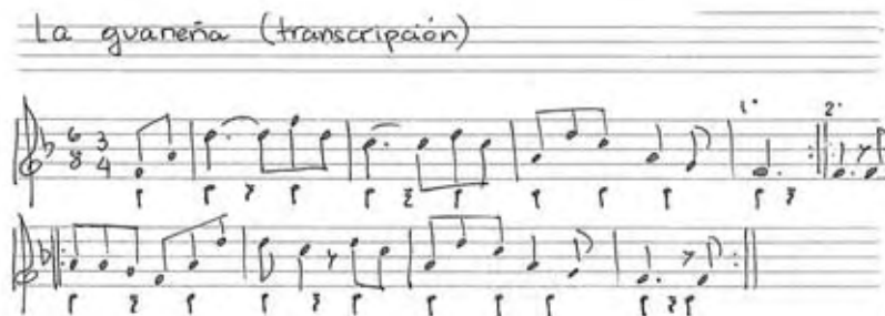
Imagen 2 – La guaneña (transcripción)

Tal y como se aprecia en los textos citados, el bambuco instrumental, como aire nacional era reconocido colectivamente como propio por los soldados. Ahora bien, existe una línea de tradición cuyo rastro ha sido difícil de seguir y que hace decir al Dr. Joaquín Piñeros Corpas que ese bambuco inicialmente no identificado, se trataba de La Guaneña , bambuco pastuso de comienzos del siglo XIX 28 :