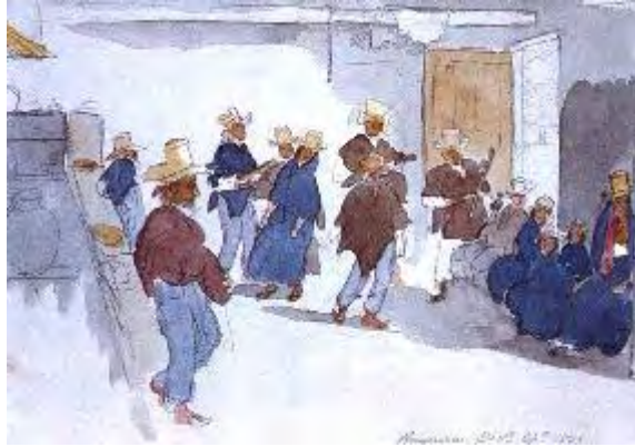
Imagen 9- Edward Walhouse Mark 42 , El bambuco , 1845

Ésta es una reinterpretación del contexto rural, con características de estilización, en el interés de darle un estatus artístico. A pesar de las dificultades que ofrece la imagen para reparar en detalles, ninguno de los bailarines usa pañuelo rabo'e gallo 43 , hoy fundamental en la coreografía, por ser elemento central del proceso de seducción. Posiblemente en la actualidad, el lugar del país donde se tiene identificado un origen coreográfico del bambuco es el Departamento del Huila, que por acuerdo del Instituto Huilense de Cultura, en 1982 adoptó el traje típico y la coreografía del bambuco sanjuanero “recogida a principios de este siglo por el costumbrista huilense David Rivero Moya” 44 .