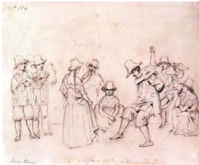
Imagen 6-Torres Méndez: El Torbellino 36