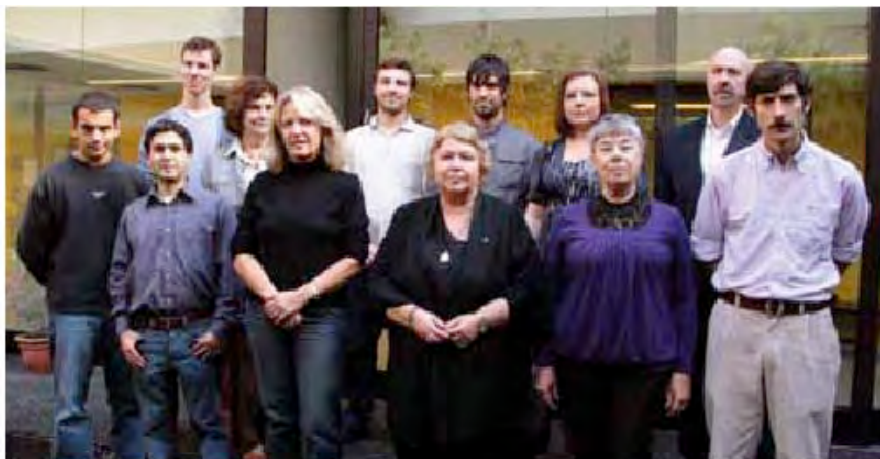
Miembros del Instituto "Carlos Vega" en su ámbito natural: la Facultad de Artes y Ciencias Musicales.