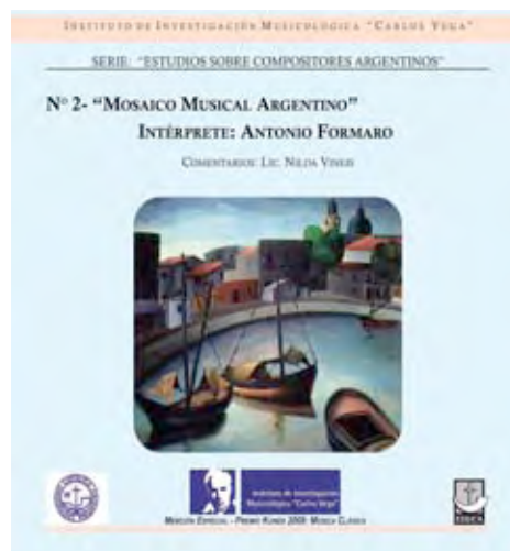
Tapa Vol. 2