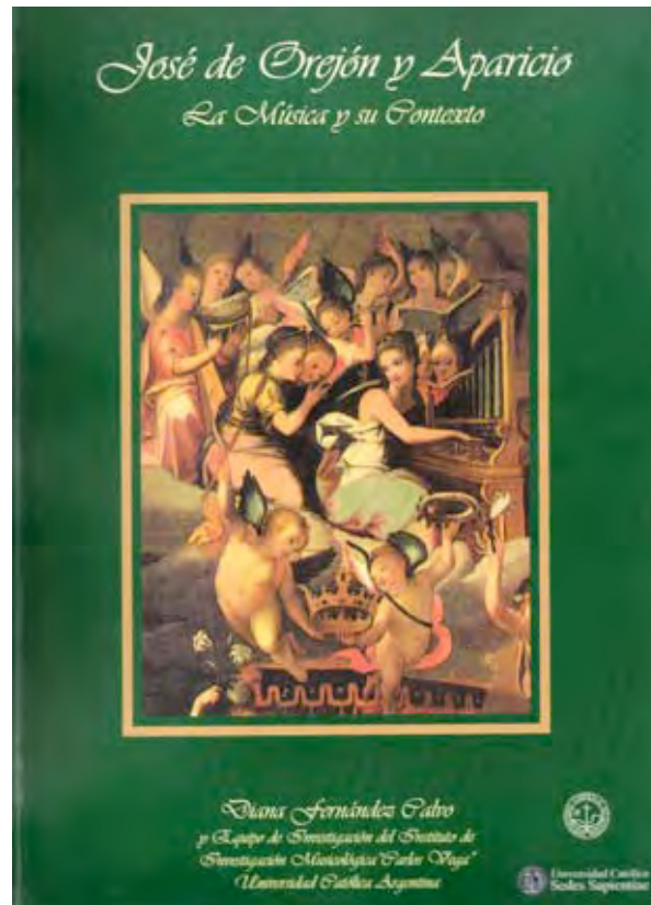
Tapa de la publicación

El miércoles 26 de agosto de 2009 se presentó la publicación en Buenos Aires en el Edificio San Alberto Magno, Sala Ginastera. Una semana después, en acto público se presentó en Lima la edición de dicha obra (mil ejemplares y la grabación), que a su vez es la primera publicación internacional del IIMCV y de la Universidad Católica Sedes Sapientiae. En noviembre del 2009 se presentó el libro ante el Arzobispo de Lima en un concierto “El esplendor del barroco musical peruano en concierto” lográndose un pleno de sala de 900 espectadores.