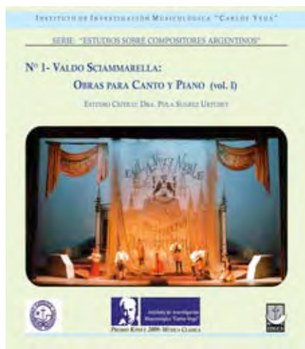
Tapa Vol. 1

Serie Estudios sobre compositores argentinos Vol 2. Mosaico musical argentino. Música para piano, grabación en piano Lic. Antonio Formaro. Buenos Aires, EDUCA, 2009.