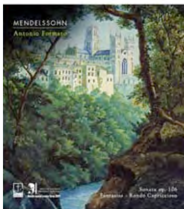
Tapa del CD