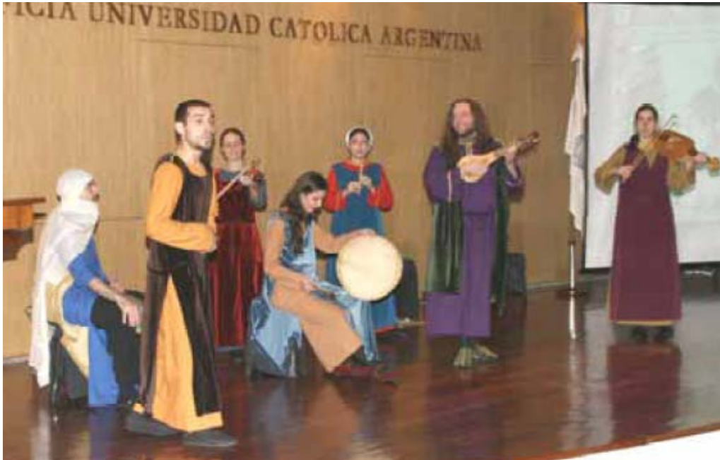
Imagen 11. Concierto de apertura a cargo de Occursus (Ensamble de Música Medieval Hispánica). 22