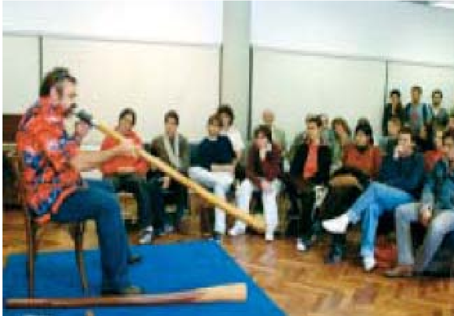
Imagen 5- Conferencia- concierto de Mark Atkins.