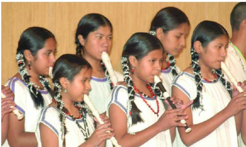
Imagen 6. Concierto de la Escuela de Música de San Ignacio de Moxos (Bolivia)

Conferencia de Luis Saguier Fonrouge. “Un aporte a la revalorización del patrimonio histórico eclesiástico desde las nuevas tecnologías.”