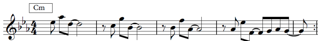
Imagen 1 - Motivo inicial (Riff 1)

a su vez comienza a repetirse como riff , a la manera de un ‘llamado’ o ‘campana’ ( Hells bells ).