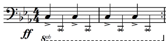
Imagen 5 - Bajo en yumba por el piano y el contrabajo

Lo rítmico más que lo melódico parece dominar el carácter de la pieza. Predominan frases acéfalas, síncopas y notas largas atacadas en tiempos débiles, presentes también en otras obras del disco. Los motivos melódicos preferentemente contenidos (de nota repetida o movimiento de grado conjunto) dejan lugar a un mayor juego con las acentuaciones. El impulso rítmico es sostenido de manera frenética por el contrabajo y el piano. Éstos ininterrumpidamente a lo largo de la pieza ejecutan un incisivo acompañamiento por octavas en el registro grave, acentuado cada dos tiempos más que cada cuatro, a la manera del marcato de yumba popularizado por Pugliese. El tempo es constante, sin pausas ni rubatos excepto por un leve sforzato en el climax de la pieza (minuto 3:00) y un ritardando en la cadencia final. La dinámica se mantiene entre forte y fortissimo sin lugar a momentos de baja intensidad, excepto en los primeros compases ya tratados. La base mantiene durante gran parte de la pieza una única función armónica: la de tónica. Cumple por tanto una función puramente rítmica: la de ‘empujar’ -literalmente- la orquesta hacia adelante con saturados y percusivos bajos que son el sello sonoro de la OTFF.