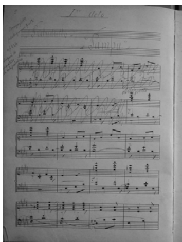
Figura 2 (p. 2)

A continuación se comenzó la transcripción en un editor de partituras actualizado. Esta labor resultó dificultosa por varios motivos. Se produjeron situaciones que necesitaron una toma de decisiones del transcriptor. Así por ejemplo, al comienzo del Preludietto del primer acto, 4 página 2, apareció la primera situación de duda. Como se ve en la ilustración, una acotación en la esquina superior izquierda dice: “Comenzar p. 49 pentagrama 7 a 12 a p 124 después de ¿parte? Ch este preludio”. Los primeros siete compases están tachados y se trata de una frase musical que se repite a continuación.